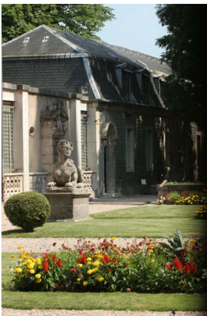
Jardins du musée

Aujourd'hui, le musée se trouve à nouveau à un tournant de son histoire. L'équipe scientifique et administrative s'est renforcée progressivement depuis 1996. Un programme de conservation préventive a été lancé en 1998 et un service de documentation s'est structuré. Riche de ses collections, le musée prépare désormais une mutation qui doit affirmer son rôle de musée à vocation régionale. La restauration des façades et des toitures du Palais Ducal, classées Monuments Historiques, a débuté en 2005 et s'achèvera en 2011.