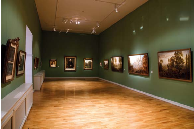
Salle de l'École de Metz