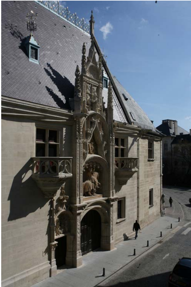
La Porterie de Palais Ducal