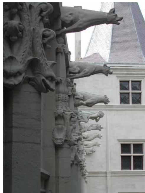
Tour de l'horloge