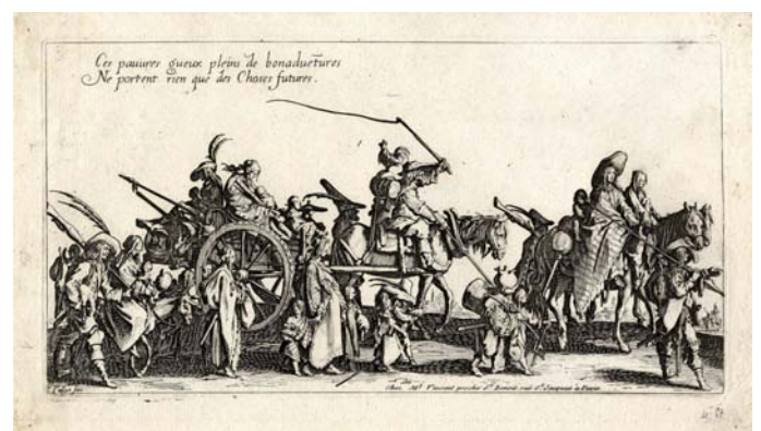
Gravure de Jacques Callot

Les arts graphiques sont largement représentés également, avec un fonds exceptionnel de gravures et de cuivres du célèbre aquafortiste Jacques Callot et d'artistes lorrains majeurs comme Jacques Bellange ou Israël Sylvestre.