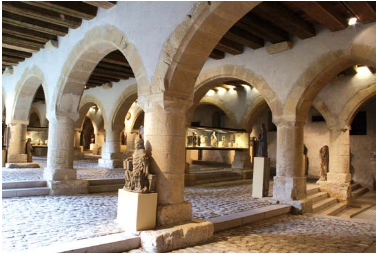
Grenier médiéval de Chèvremont