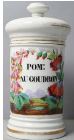
Pot à pharmacie

Le musée possède également des collections scientifiques, pharmaceutiques et médicales, d'un intérêt remarquable, témoins de l'histoire des sciences en Lorraine aux XVIII e et XIX e siècles (cabinet scientifique du roi Stanislas).