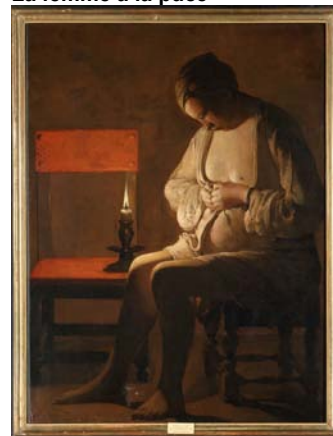
La femme à la puce

La collection de sculpture, une des plus belles des musées français, compte également des œuvres majeures : le Retour du Croisé , sculpture du XII e siècle au thème unique, un rare ensemble de gisants des XV e et XVI e siècles, avec notamment celui de la Duchesse Philippe de Gueldre par Ligier Richier et, pour le XVIII e siècle, les œuvres de Clodion, sculpteur originaire de Nancy.